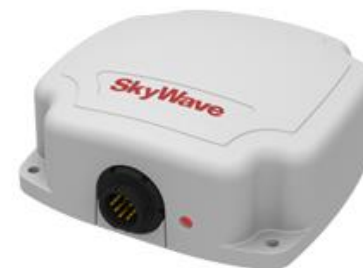
Skywave – IDP 680 de Inmarsat