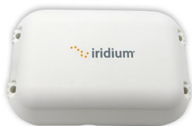
Iridium Edge de Iridium