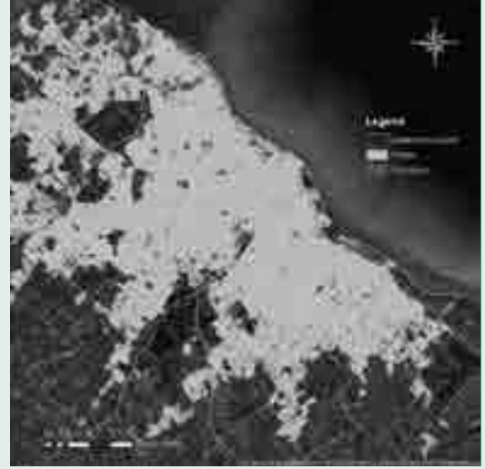
Crecimiento demográfico 1990-2014.